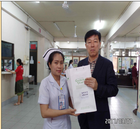
라오스 병원 현장사진